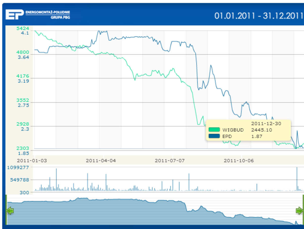
Wykres 1: Kurs akcji Energomontażu Południe S.A. na tle indeksu WIG-Budownictwo w 2011 r.

Według stanu na dzień 31 grudnia 2011 roku kurs akcji EPD wynosił 1,87 zł. Notowania akcji Spółki w okresie 2011 roku praktycznie podążały za zmianami indeksu WIG-Budownictwo. Kapitalizacja Spółki na koniec okresu sprawozdawczego wynosiła 132,7 mln zł.